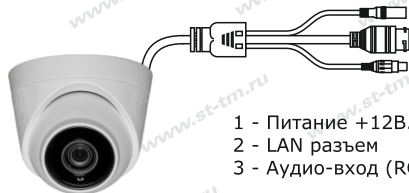
Рис. 1 Схема подключения видеокамеры